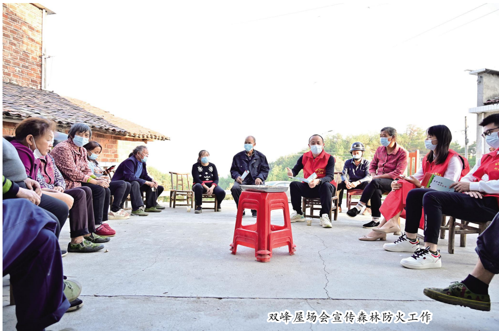
双峰屋场会宣传森林防火工作

此外,我市易扶党建“娄底经验”被中组部、省委组织部推介推广,在《湖南工作》2022年第2期大篇幅推介,在全省基层党建重点任务推进会上作典型发言。“两后生”教育培训和就业创业帮扶工作,获国务院打击治理电信网络新型违法犯罪工作部际联席办发文通报推介和庆伟书记批示肯定。全面推进“一切工作到支部”做法获省委常委、组织部部长汪一光同志高度肯定并推介。