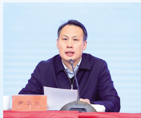
市委副书记、政法委书记尹华凯作工作报告