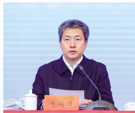
市委副书记、市长曾超群主持会议