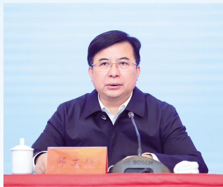
市委书记邹文辉讲话