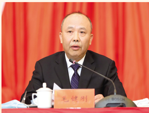
市委常委、市纪委书记、市监委主任毛健刚作工作报告