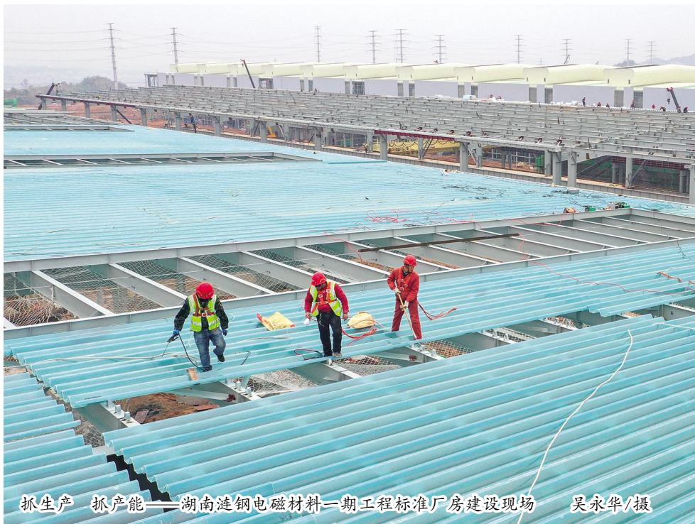
抓生产 抓产能——湖南涟钢电磁材料一期工程标准厂房建设现场

是,在过去,一些低档板材,包括螺纹钢,出厂后直接运到工地,不会形成产业链。甚至涟钢和安赛乐米塔尔合作生产的全世界最好的汽车板,出来之后也是直接运到上海,交给特斯拉,交给上汽,中间没有产业链可言。2020年以后,市委市政府提出“双引擎”,找准高强钢和工程机械之间的结合点,促进了高强钢的高速发展。但是,工程机械整个产业的体量并不是特别大,峰谷周期过短,波动过于明显,在我市形成了一条产业链,但是没有起支撑性作用。而硅钢发展不像汽车板一样点对点,它是可以形成包括电机、变压器、小家电在内的一系列的产业链。比如,在去年年底的项目启动仪式上有一个叫乐立宝的项目,做变压器的,终端产品在我们这