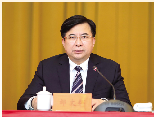
市委书记邹文辉讲话

2月2日,市第六届纪委第三次全会召开。市委书记邹文辉出席并讲话。市委副书记、市长曾超群出席。