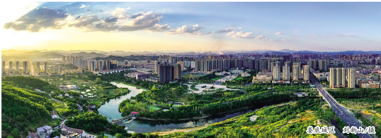
娄底城区