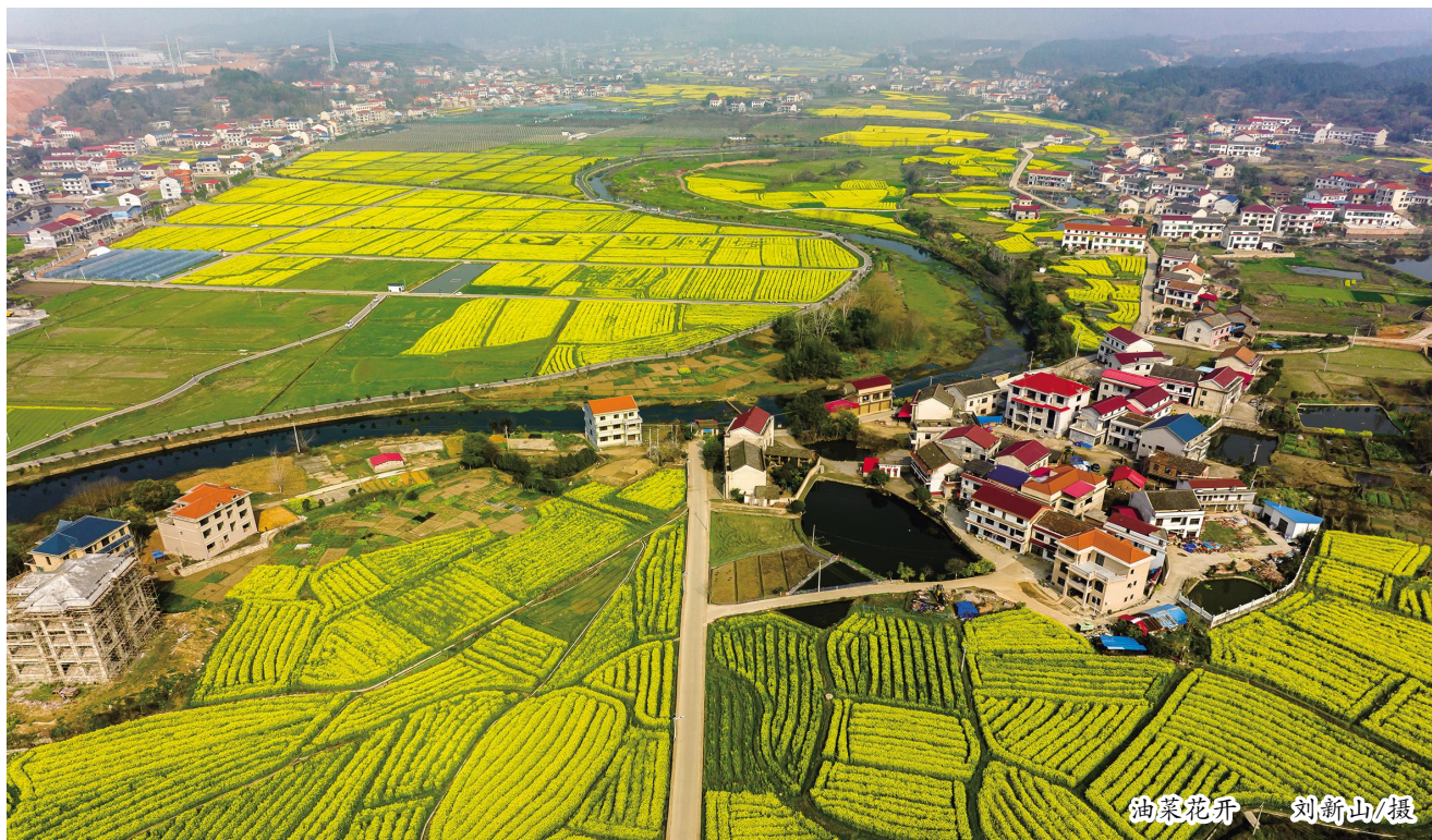
油菜花开

此斩断贫困的代际传递。要在全市范围推广双峰县义务教育高质量发展经验。建好用好乡镇卫生院、村卫生室,推进全科医生签约全覆盖,加大基层医疗卫生人才定向委培量、提高履约率,加强医联体、医共体建设,完善分级诊疗,让群众在家门口就能享受良好的医疗服务。努力提升养老服务水平,有条件的地方要对孤寡老人进行集中供养。