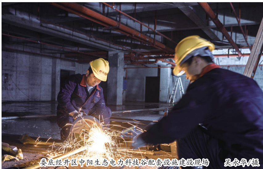
娄底经开区中阳生态电力科技谷配套设施建设现场

要提升能力抓落实。习近平总书记提出要增强“八项本领”和“七种能力”,并强调“既要政治过