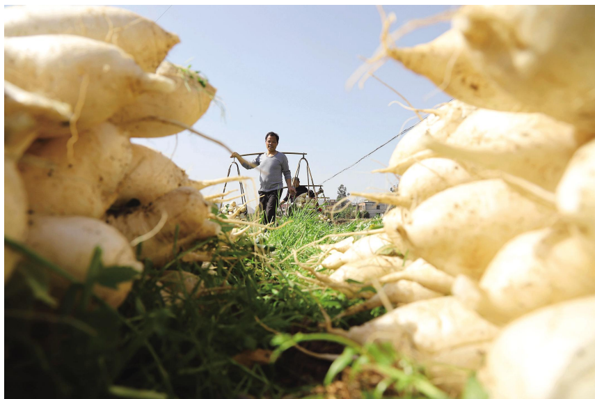
小萝卜大产业

极主动作为,切实招大引强、培优育强、延链补链,确保年内取得实质性突破。要拓空间、重节约。树立大食物观,从传统农作物和畜禽资源向更丰富的生物资源拓展,向森林、草地、河库要食物,加快构建粮经饲统筹、农林牧渔结合、植物动物微生物并举的多元化食物供给体系。推进粮食生产全链条减损,深入开展“光盘行动”,在全社会形成崇尚节约的良好风气。要提能力、防天灾。发动