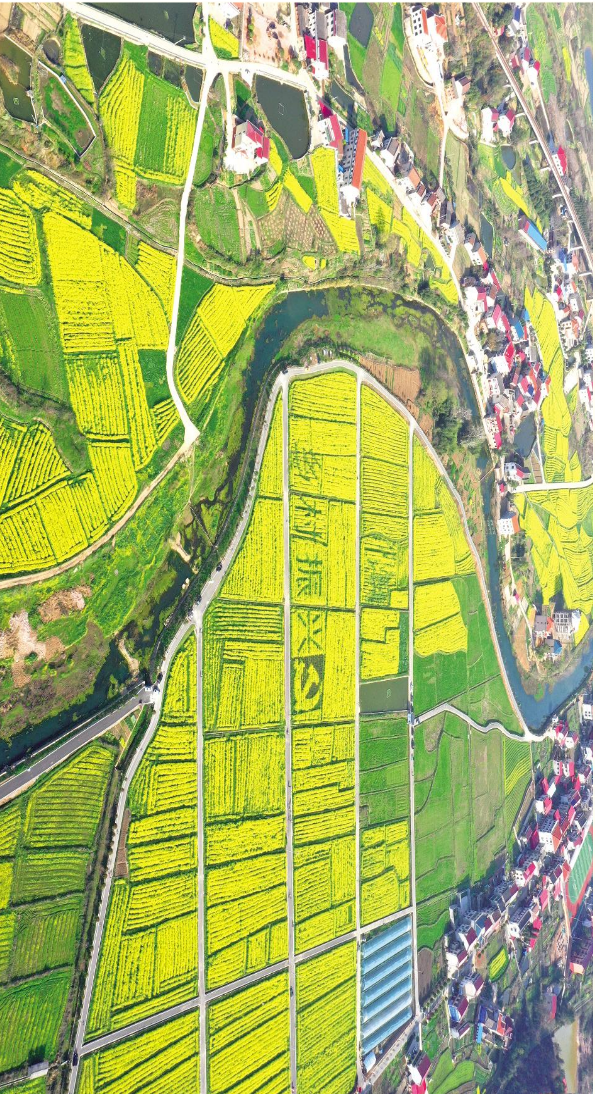
美丽乡村——葵星区中阳村